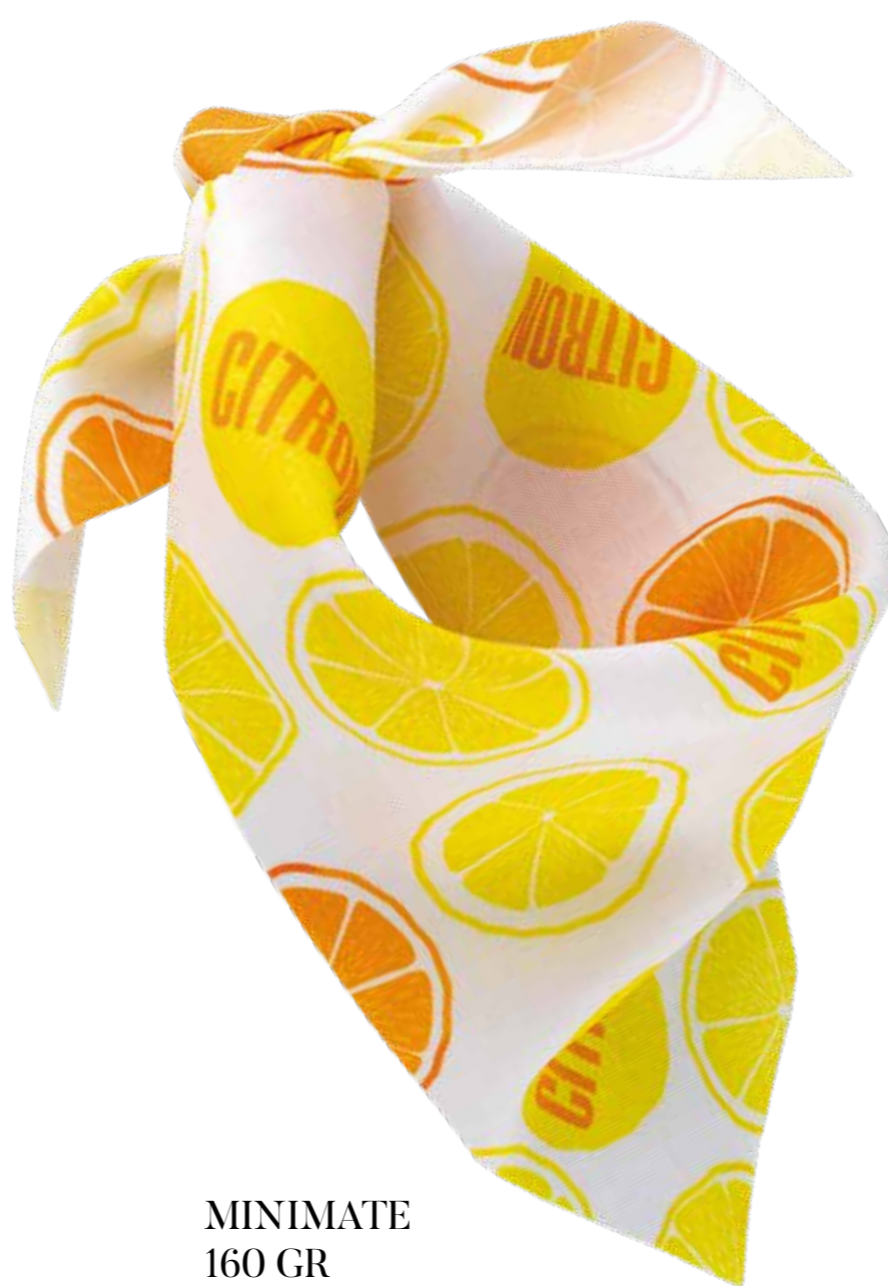
MINIMATE 160 GR