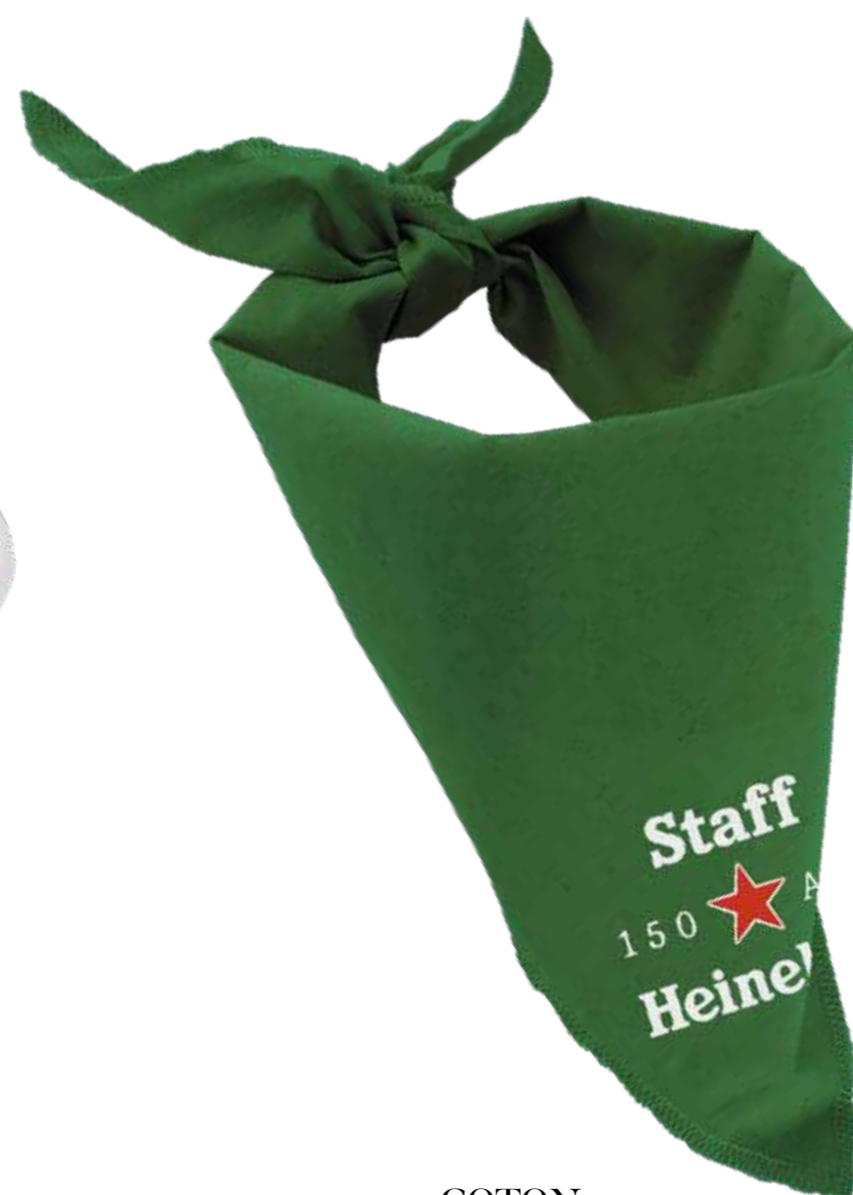
COTON naturel ou recyclé 150 GR *