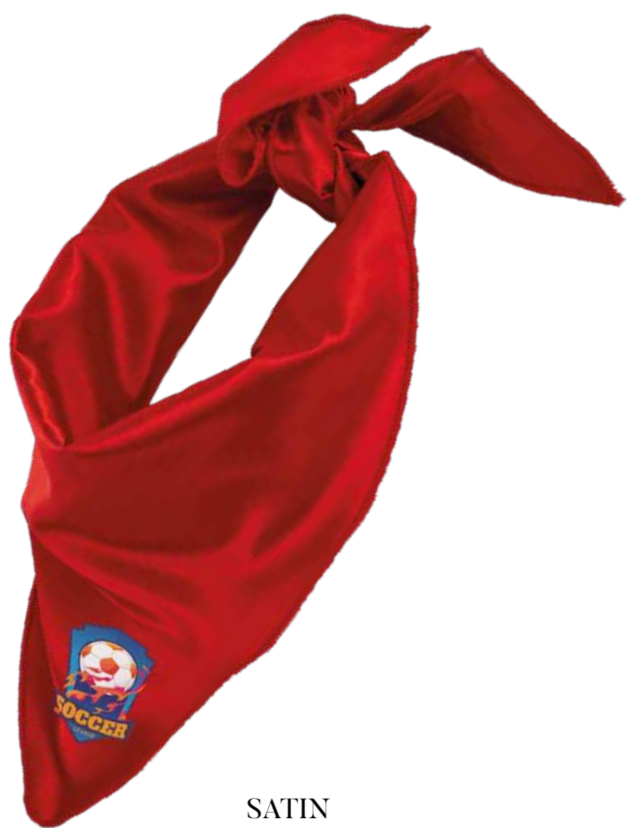
SATIN 130 GR